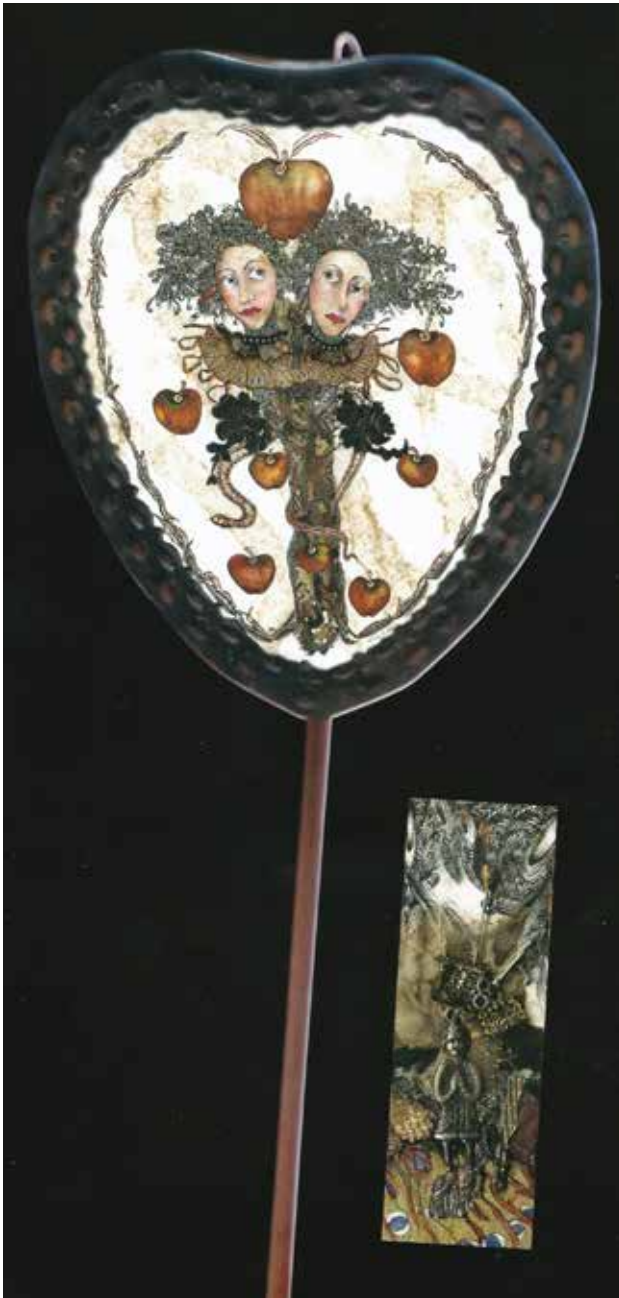
© Perla Estrada. Fiebre la piel y a dónde la manzana...

miento histórico en los estudiantes de la Licenciatura en Educación Preescolar y Primaria. México: DGSPE. Obtenido el día 18 de diciembre 2017, desde https://www.dgespe.sep.gob.mx/public/comunidades/historia/recursos/educacion_historica_19_de_agosto_2012.pdf