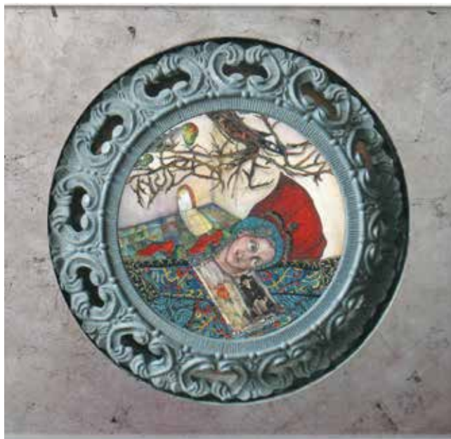
Viaje al centro del corazón

Algunos de los aprendizajes esperados fueron: Indaga acerca de su historia personal y familiar; Comparte anécdotas de su historia personal a partir de lo que le cuentan sus familiares y, de ser posible, con apoyo de fotografías y diarios personales o familiares; Se forma una idea sencilla, mediante relatos, testimonios orales o gráficos y objetos de museos, de qué significan y a qué se refieren las conmemoraciones de fechas históricas; Identifica y explica los cambios en las formas de vida de sus padres y abuelos partiendo de utensilios domésticos u otros objetos de uso cotidiano, herramientas de trabajo, medios de transporte y de comunicación, y del conocimiento de costumbres en cuanto a juegos, vestimenta, festividades y alimentación.